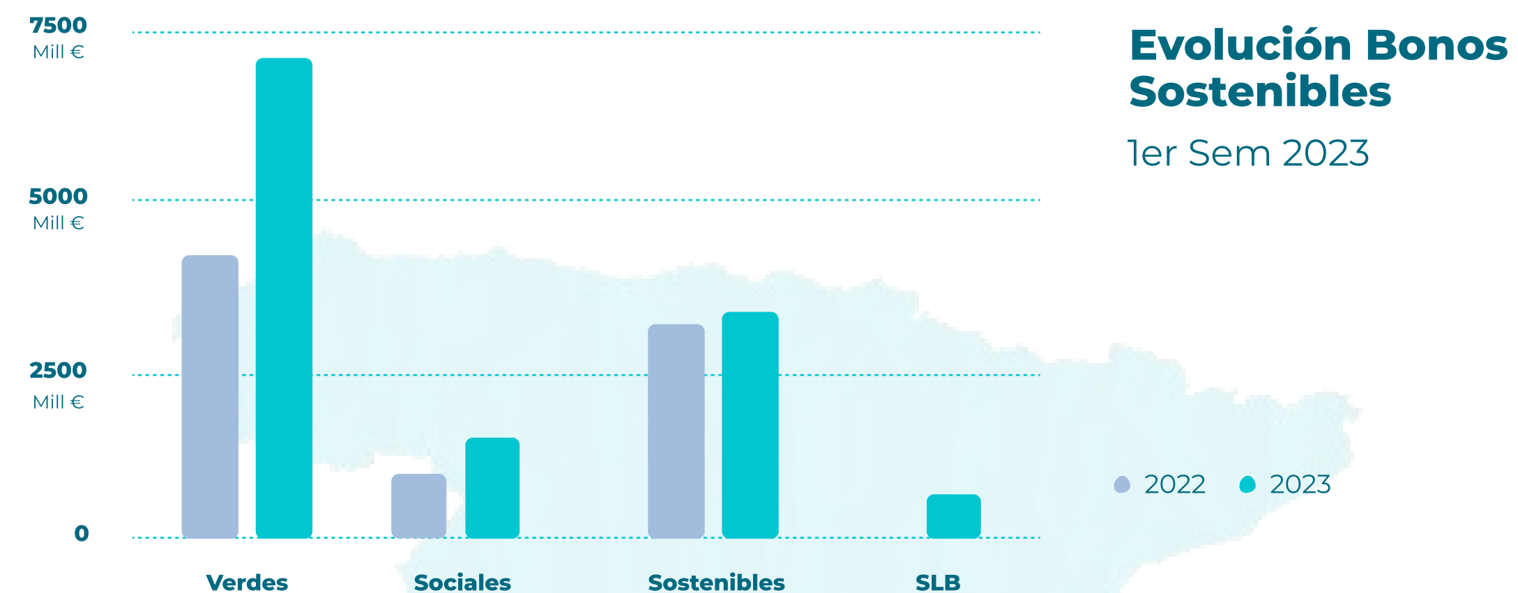
Distribución por categorías Ter Sem 2023